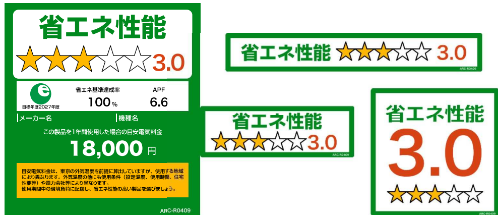
(家庭用エアコンディショナーのイメージ)