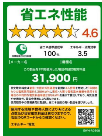
(電気温水機器のイメージ)

※温水機器以外は、製品のサイズやネット取引等の限られたスペースで使用する場合は右側のミニラベルを活用すること。