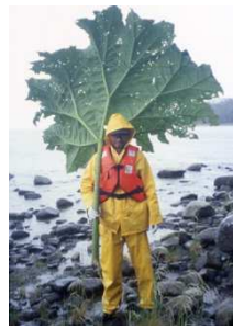
南米チリのタイオオ半島調査

地球の過去を調べることによって未来を予測することが、地表の岩石を調べることによって地球の深部での出来事を明らかにすることができます。例えば、地球史46億年での重要なイベントや地震が発生した証拠などです。世界各地でのフィールド調査を写真などで紹介し、何をどのようにして明らかにしたかを紹介します。