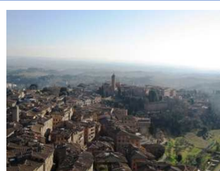
シエーナの市街地と田園