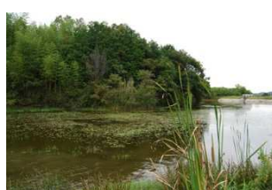
質のよい環境基盤が維持されているため池 (東かがわ市)