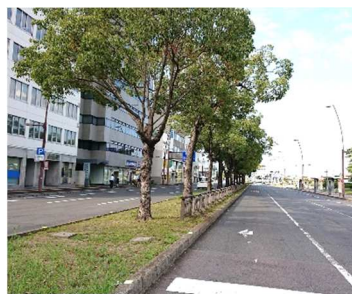
高松市街地の街路樹

街路樹、植え込みなどの「まちなかのみどり」は、枝葉の伸長・落葉落枝による交通支障や、雑草・虫などの発生を理由として邪魔者扱いされがちです。「みどり」は私たちに様々な恩恵(=多面的機能)をもたらしてくれるのですが、どのような機能がどのくらいあるのか、見えにくいのが邪魔者扱いされる一因ではないかと考えています。こうした「緑の多面的機能」とその評価の試みについて紹介します。