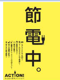
節電ポスター

省エネルギー(以下省エネ)の推進は今後ますます必要となりますが、何も我慢することだけが省エネという訳ではありません。省エネとはそもそも何か、どうして必要となったのか、様々な省エネルギーの取り組みどの程度の効果が期待できるのか、省エネ行動は周辺にどのような影響を与えるのか…。これらの事柄について、私が専門とするエネルギー需給、温熱環境の観点から考えてみたいと思います。