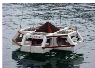
潮の流れをコントロールする機能を持つ環境改善構造物