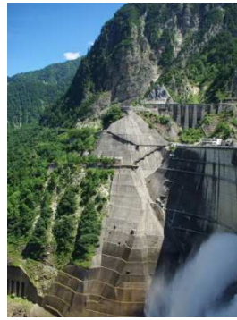
水力発電(黒部ダム)

世界的にも注目されている地球温暖化ですが、我々は何をするべきなのでしょう。再生可能エネルギーの推進や電気自動車の普及など、国レベルでの対策が求められています。地球温暖化のような不確実な現象に対して、我々がとるべき対策を考えるためには「確率」に対する考え方がとても重要になります。本講義では、不確実な事象のとらえ方を考えるとともに、地球温暖化の影響やその対策について紹介します。