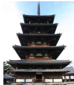
国宝 法隆寺五重塔

神社や寺に代表される日本の歴史的建造物は、地域のシンボルとして大切に受け継がれてきました。近年では観光資源としても活用されており、地域の活性化に貢献しています。講義では、このような歴史的建造物の修復方法や活用方法とともに、地震や台風などの自然災害から建物を守る技術について紹介します。