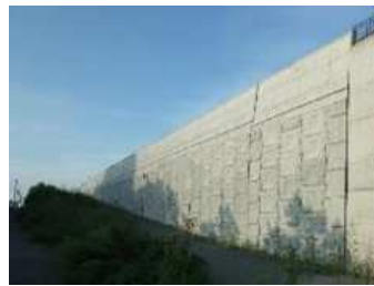
土でつくられた社会基盤構造物の例（補強土壁）

土は我々が生活する地盤を構成しているのみならず、古くから様々な構造物の材料として利用されてきました。現代社会においても、様々な技術・知見を取り入れながら、数多くの社会基盤構造物が土でつくられています。本講義では、土でつくられた社会基盤構造物を対象として、その種類や役割、用いられている技術について、安定や変形といった力学的性能を踏まえながら学びます。