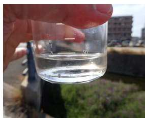
河川水には何が含まれているのでしょうか？