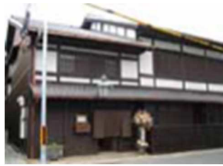
民家を転用した高齢者の 小規模多機能ホーム

少子高齢化により福祉、医療などへの対策が重要な課題となっています。環境のあり方を工夫して多くの人々が不自由なく生活できるようにすることがユニバーサルデザインだと言われています。すべての人が安心して快適に暮らせることを目指す福祉の視点からユーザー本位の施設づくりやまちづくりについて調査事例をもとに紹介します。