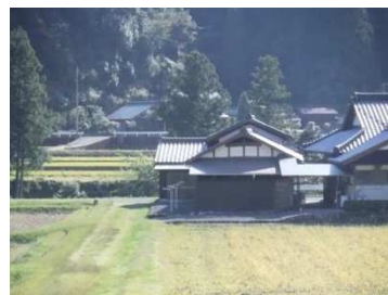
文化的景観（松野町）

近年の歴史的建造物に関わる動きとして、建造物単体だけではなく、歴史的な町並み景観や、文化的な集落景観の視点から、まちづくりとして保存活用を目指す動きが活発化しています。四国で注目されている魅力的な建造物や景観の事例をご紹介します。