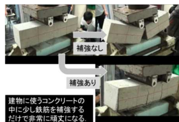
コンクリート部材の耐荷力試験

四国においても、他の地域と同様に地震による被害が予想されます。建物の中に居住している人間が、地震時であっても無事であるためには、建物が頑丈であり、この頑丈さが長続きしなくてはなりません。この講義では、頑丈で長持ちする建物のつくりかたについて学びます。