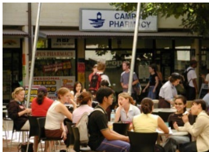
キャンパスの風景