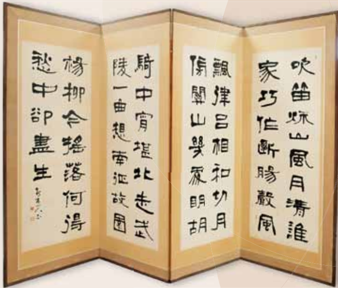
特別展示 藤原 鶴来「吹笛秋山」