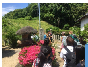
屋島から史跡の探索。たくさんさんのバディと一緒に