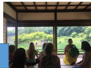
栗林公園掬月亭にて、日本の庭園の美に触れる