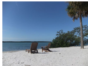
美しいビーチのあるキャンパスと、アクティブラーニングに基づく学び