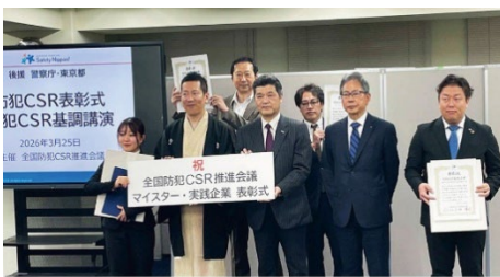
「2026年3月25日 第7回防犯 CSR 実践企業表彰 全国防犯 CSR 推進会議」