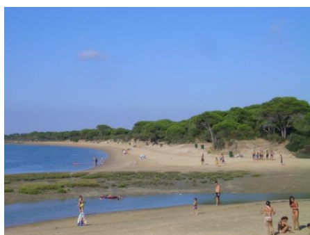
プエルトリアル国立公園