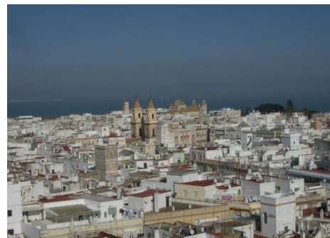
メインキャンパスは旧市街に点在しています