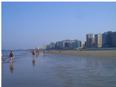
メインキャンパスのあるカディス市