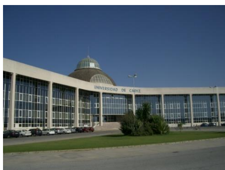
カディス大学プエルトリアルキャンパス

香川大学農学研究科から2名の学生がそれぞれ5ヶ月留学した。また、共同研究も継続して行われており、関連する国際学会などで共同してシンポジウムを開催している。