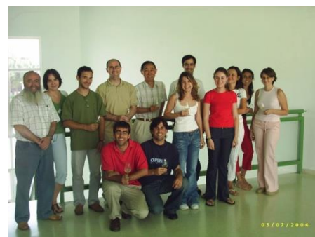
カディス大学理学部の留学生