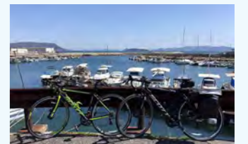
好みのデザインの愛車とともに旅します