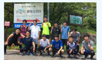
五色台ヒルクライム後の集合写真