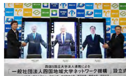
左から 鳴門教育大学長、徳島大学長、愛媛大学長、高知大学長、香川大学長

学、香川大学、愛媛大学、高知大学）が設立時社員となり「一般社団法人四国地域大学ネットワーク機構」が設立され、3月18日設立式と記者会見が香川大学で行われました。はじめに寛学長から法人の紹介があり、続いて代表理事である鳴門教育大学長、ZOOM出席で徳島大学長、愛媛大学長、高知大学長から挨拶がありました。