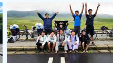
雨の中、登り切った阿蘇山