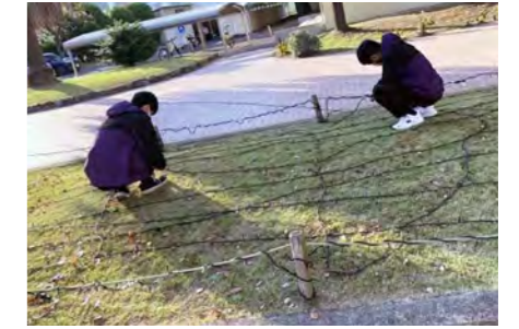
イルミネーションの設置準備