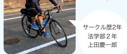
サークル歴2年 法学部2年 上田慶一郎