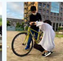
自転車のメンテナンスで快適な走りを実現します