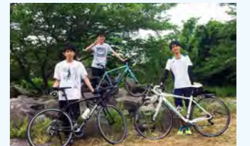
自転車タイムレースでのTOP3です