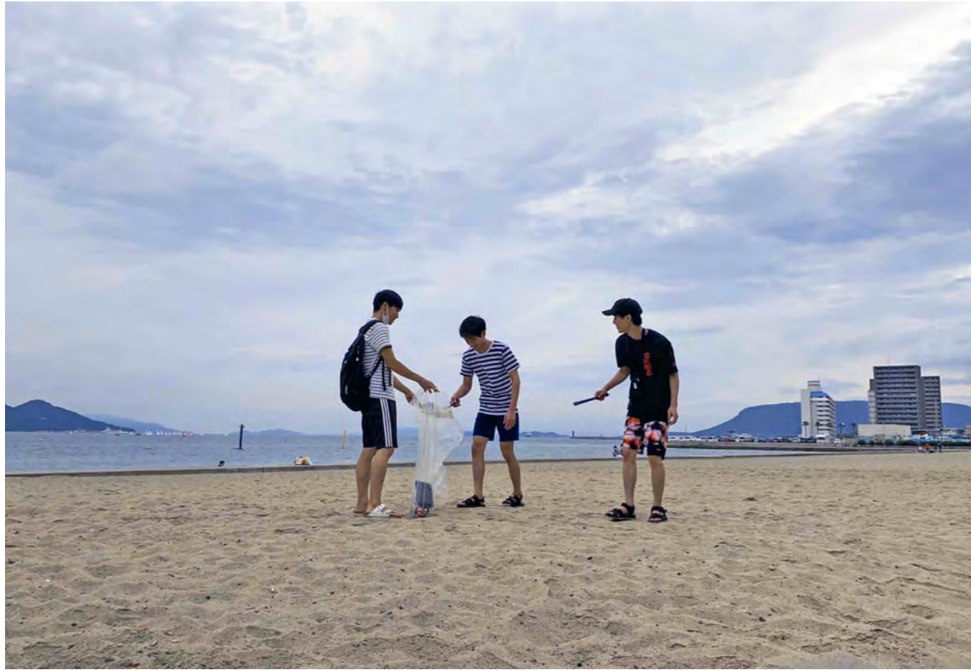
海の日に大学から徒歩15分ほどにある大の場海岸へ清掃に行きました

ボランティアサークル「ブルームネクスト」は、活動コンセプトの「地域と大学を繋ぐ」を大切に日々活動しています。