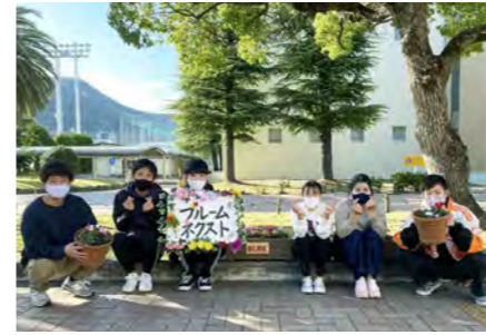
ブルームネクストのメンバーと

発足したばかりのサークルですので年間行事のフォーマットは存在せず全て自分たちで活動内容を考えています。一人ひとりがサークル内で持つ裁量権が大きくメンバー全員で最初の一步を踏み出す経験ができることは大きな魅力です。メンバーは他の部活・サークルに入っている人も多く話題が豊富で愉快な人たちがばかり。コロナ禍により行動の制限は、まだしばらくは続くかもしれませんが“今”できることはあります。“学生にできることは何かあるのか”と一緒に考え活動してみようという方、お待ちしております。