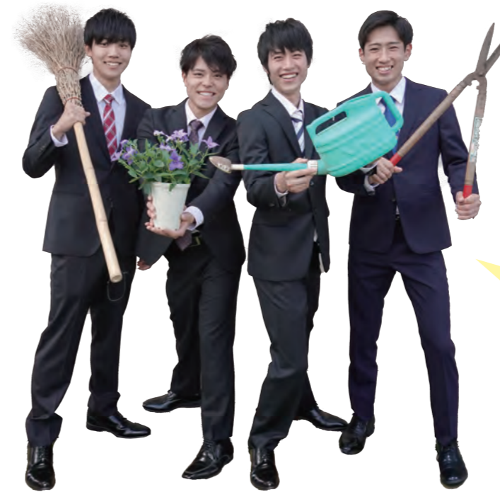
ブルームネクスト発足メンバー