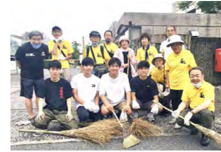
「ほうきの会」のメンバーと