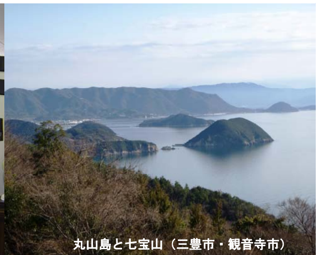
丸山島と七宝山（三豊市・観音寺市）