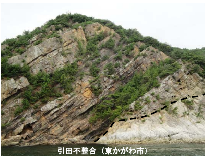
引田不整合（東かがわ市）

香川県は1400万年前の奇跡の瀬戸内火山活動によって形成された美しい里山や火山岩頸を利用した石の文化があります。 讃岐ジオパーク構想は、母なる大地によって育まれた讃岐平野と備讃瀬戸を世界のジオパークとして認定してもらい、地域の自然・歴史・文化を生かして持続的に発展していくことをめざしています。