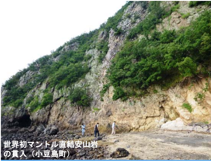
世界初マントル直結安山岩の貫入（小豆島町）