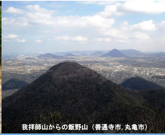
我拝師山からの飯野山（善通寺市、丸亀市）