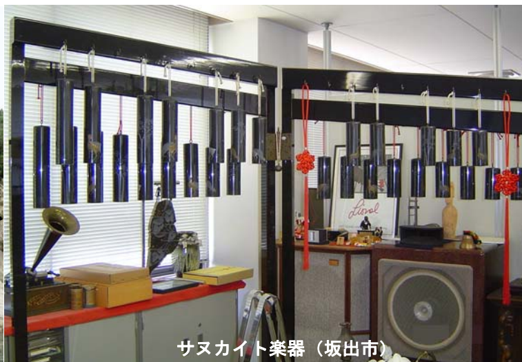
サヌカイト楽器（坂出市）