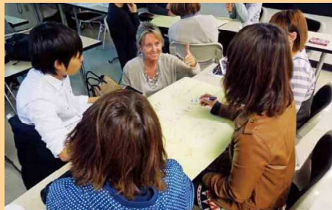
香川大学 ネクスト プログラム

語学力を養い、海外留学して国際的な専門知識身につける「グローバル人材育成プログラム」。