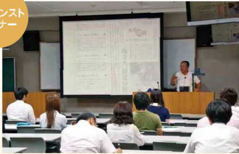
アドバンス セミナー

土日や授業終了後の時間等を利用して、社会第一線の方々を講師に、学修意欲の高い学生たちが先進知識を習得する。