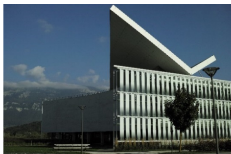
ブルジェキャンパス

●学部・大学院生 13,000人 ●教職員 1,260人 ●留学生 1,200人 ホームページ https://www.univ-smb.fr/en/ 交流協定締結年月日：2000年3月24日 主管学部：創造工学部