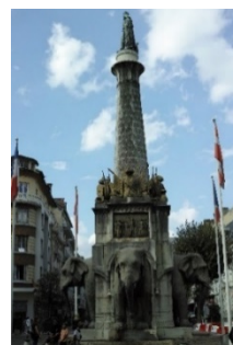
シャンベリーの街並み