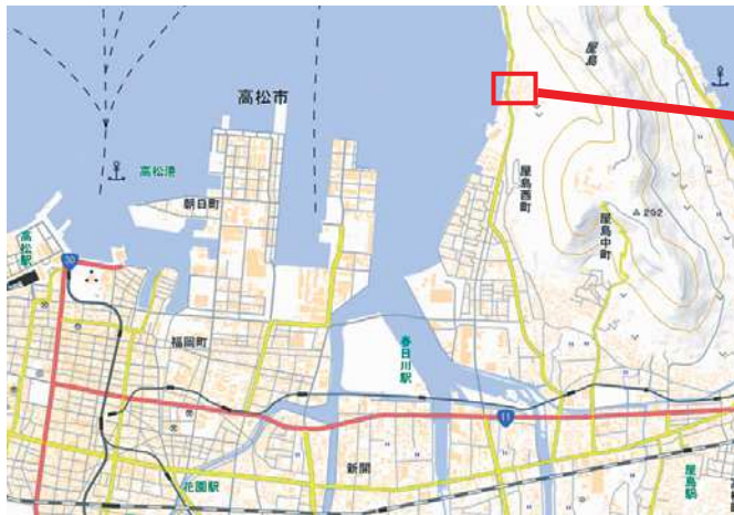
※国土地理院の地図にバス停、集合場所を追記して記載