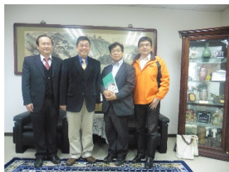
交流協定合意時・校長先生と

▶学部学生 約16,000人 ●大学院生 約4,000人 ●教職員 約1,000人 ホームページ http://www.pccu.edu.tw/ 交流協定締結年月日：2017年8月1日 主管学部：法学部