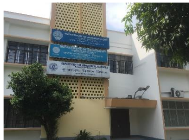
ガウハチ大学地理学部の入口