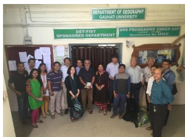
ガウハチ大学地理学部のメンバーと