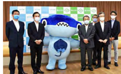
締結を喜ぶ四国水族館キャラクター「しゅくくん」と一同

本協定締結により、四国水族館との連携が強化され、本学の教育・研究分野における取組や実績に加え、四国水族館が展開する様々な事業や多面的な機能を活かして、学校教育における創造的活動や観光振興による地域活性化を含め、教育、研究、地域・産業振興における幅広い連携が進展するものと期待されます。