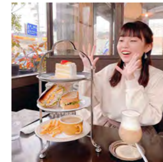
スイーツ巡検では1日に数件のお菓子屋さんをまわることもあります。