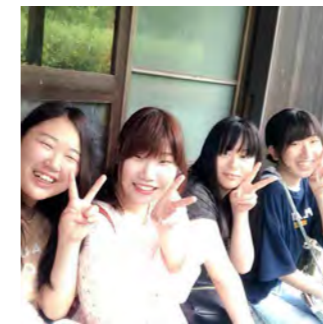
メンバー同士仲良く活動しています。意見交換などは真剣におこない、高め合っています。