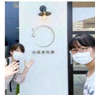
リモートスイーツ巡検でお世話になったお菓子屋さんにご挨拶に行きました。