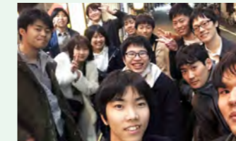
時にはみんなでご飯に行ったり