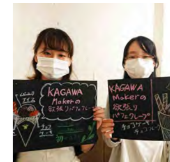
クレープ屋さんとの商品開発が実現しました。課題もたくさんありますが、アイデアが形になるのは嬉しいです。