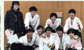
12月に部内で幹部交代式を行います