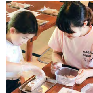
直島で主催したワークショップイベントです。参加した方たちの満足度が高くやりがいを感じられました。