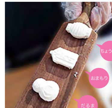
ちようちゃん おまもり だるま

KAGAWA Maker オリジナルの菓子木型を作りました。日本らしいモチーフの型を作っていました。