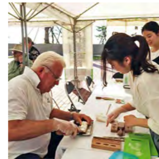
大型客船寄港イベントで和三盆干菓子作りを手伝いました。拙い英語ですが一生懸命説明しました。