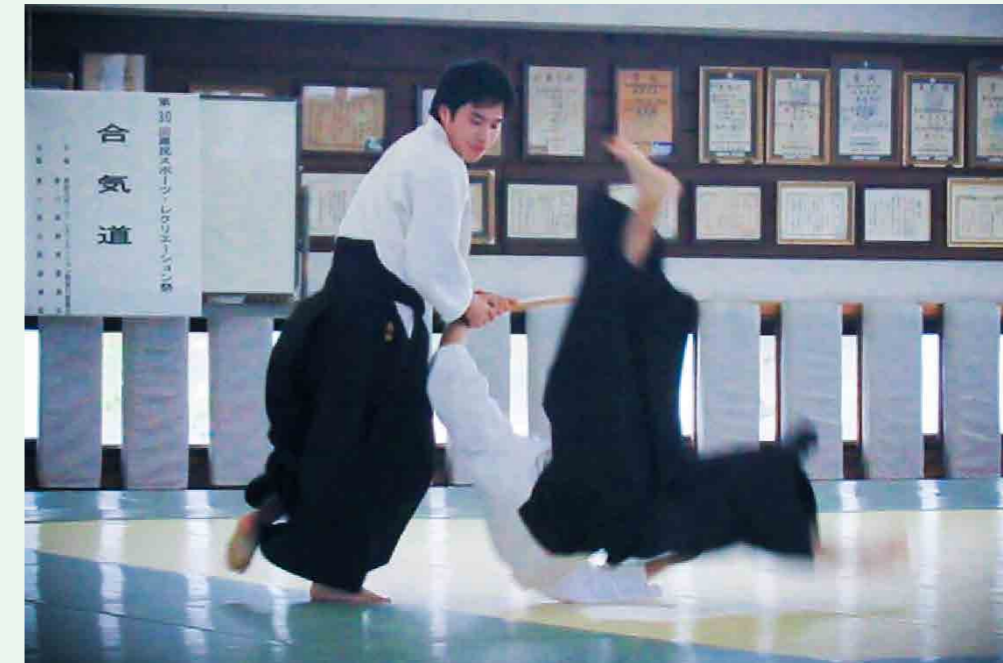
演武大会で稽古の成果を発揮