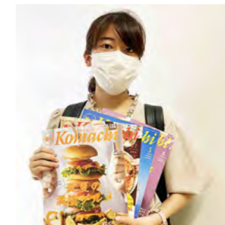
香川のタウン情報誌「Komachi」で連載させていただいています。香川のお菓子の情報をもっとお届けしたいです。