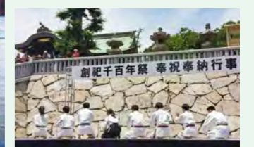
地域の行事に参加させていただけることも!