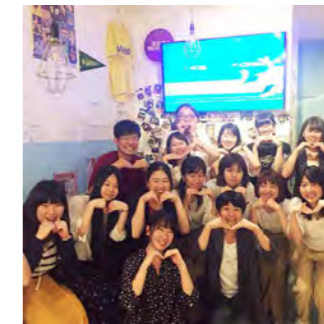
昨年度に KAGAWA Maker のメンバーが集まったときです。