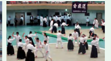
年に数度、全国規模で演武大会が開催されます