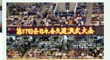
日本武道館の中心に立ち演武をすると気持ちが昂ります