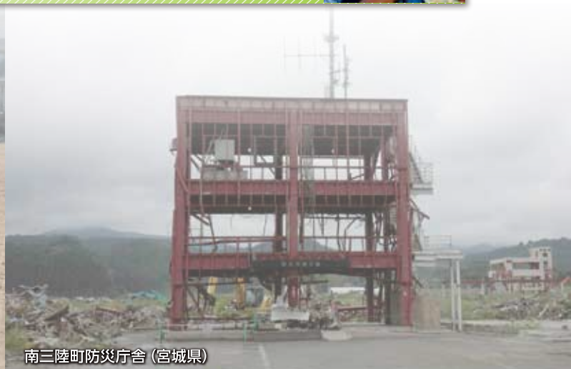
南三陸町防災庁舎 (宮城県)