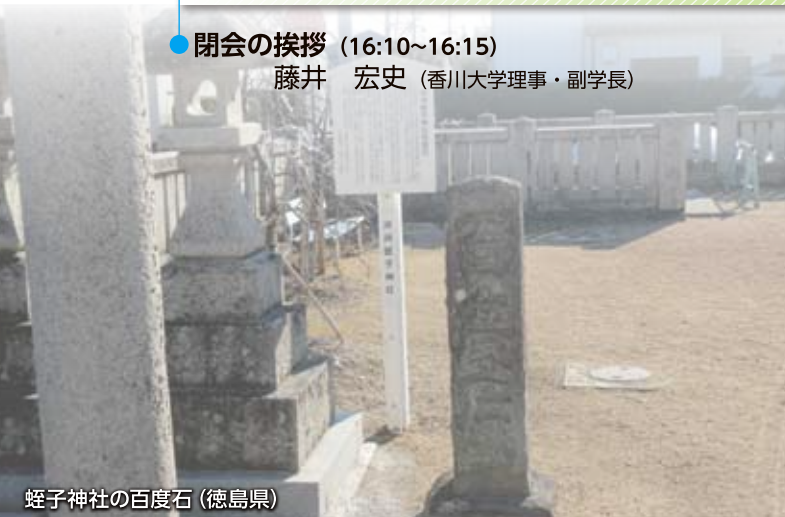
蛭子神社の百度石 (徳島県)