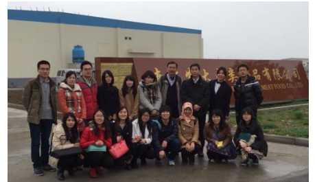
南京農業大学設立畜産加工工場訪問

中国農業部に所属する重点大学で、中国で最も古い有名な農業大学のひとつ。メインキャンパスは南京市郊外の景勝地に位置し、校地面積9km 2 、校舎敷地面積72万m 2 、図書館蔵書206万冊を有している。農学を主体に、工学・理学・経済学・文学といった教育研究分野も拡充されつつある。本学農学部との間で、学生の受入・派遣による交流が進んでいる。