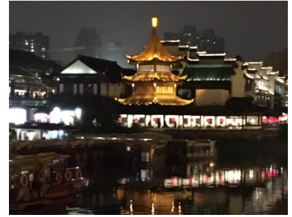
南京夫子廊の夜景