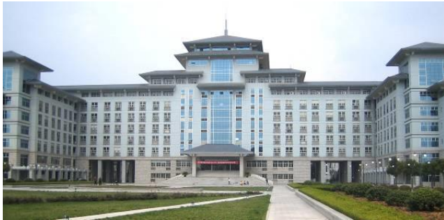
南京農業大学本部