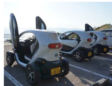
小豆島の超小型電気自動車

交通は人間の活動を支える重要な要素です。私たちは交通ICカードのデータを用いた交通行動の分析や交通システムの評価、超小型電気自動車の活用実験、四国の鉄道の経済性分析など交通政策に関わる様々な研究を行っています。