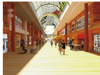
商店街の色彩景観実験

日本を元気にするために、地方の活性化が求められています。私たちは、高松市の中心市街地や島嶼部の観光振興など、地域を活性化するための研究に取り組んでいます。テーマに応じて、香川県や高松市などの行政や、経済や情報の先生とも連携して研究しています。