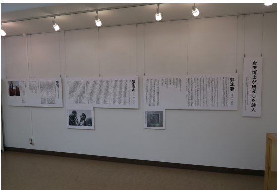
スクラップブック