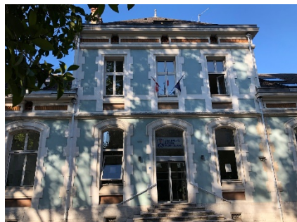
シャンベリーキャンパス本部