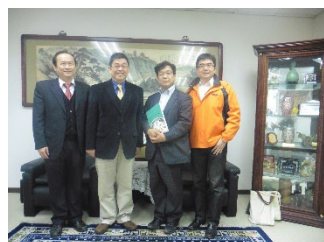
交流協定合意時・校長先生と