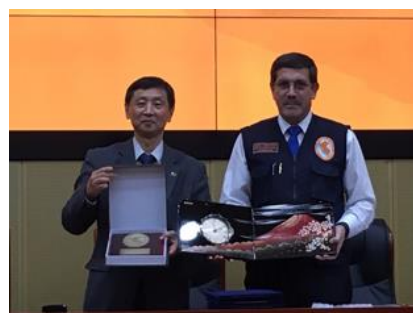
協定覚書署名式の様子