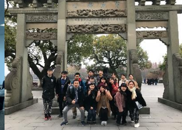
市の中心にある西湖