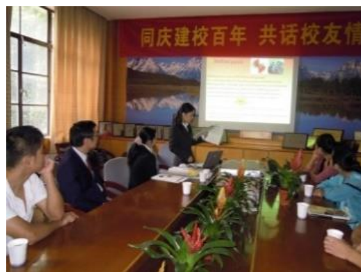
両大学院生による研究発表会風景