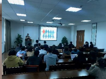
浙江工商大学学生の参加