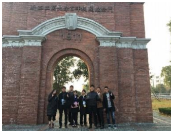
浙江工商大学正門