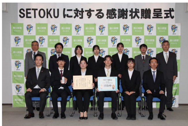
感謝状贈呈式後の記念撮影