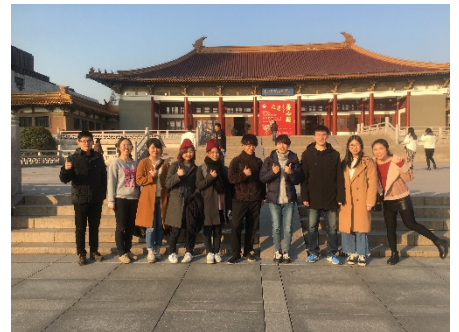
南京博物院での学生交流2018

中国農産部に所属する重点大学で、中国で最も古い有名な農業大学のひとつ。メインキャンパスは南京市郊外の景勝地に位置し、校地面積9km 2 、校舎敷地面積72万m 2 、図書館蔵書206万冊を有している。農学を主体に、工学・理学・経済学・文学といった教育研究分野も拡充されつつある。本学農学部との間で、学生の受入・派遣による交流が進んでいる。