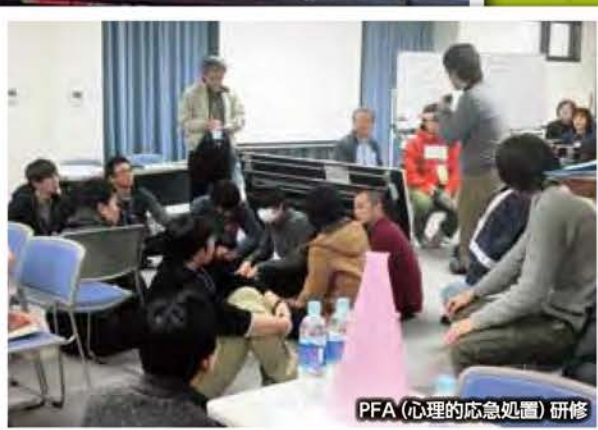
PFA(心理的応急処置)研修