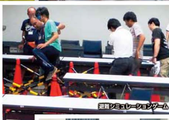
避難シミュレーションゲーム