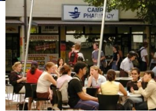
キャンパスの風景