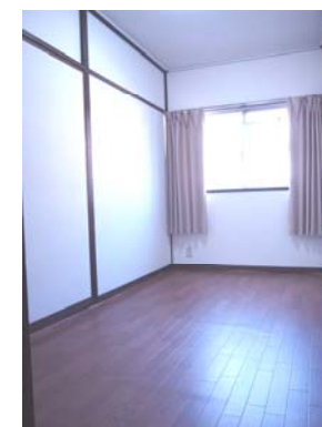
Room1 (store room)