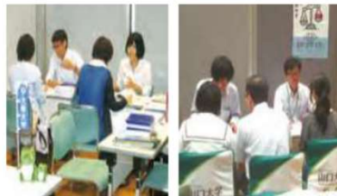
■個別懇談会参加大学(11:45~16:30)