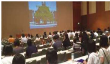
■全体説明会(11:30より開場)