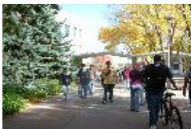
授業の合間に移動する学生(左は図書館)