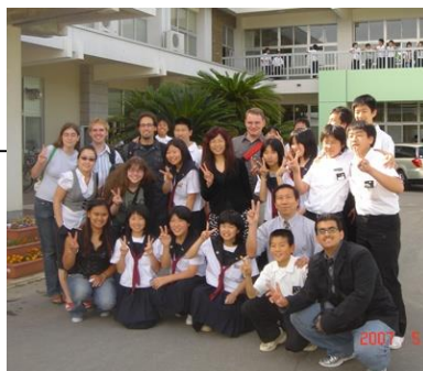
研究者・学生交流の様子