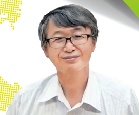
四国危機管理教育・研究・ 地域連携推進機構副機構長

「ブラタモリ」でおなじみの 長谷川先生とホームカミングデーで ブラブラしましょう!!