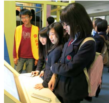
地震教育センター