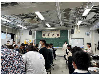
CSUと附属坂出中学校生徒保護者との交流活動