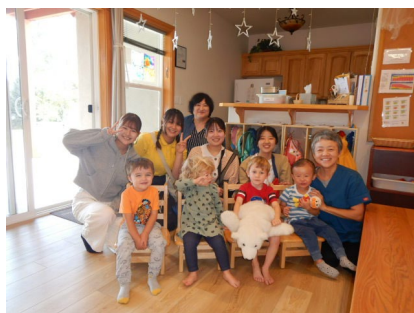
託児施設での活動