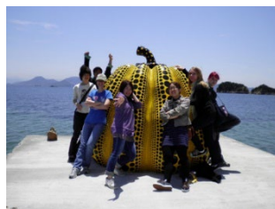
直島フィールドワーク