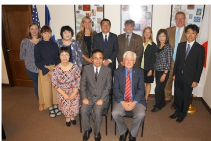
デンバー総領事も同席しての調印式