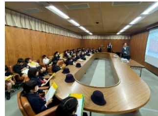
↑ 高松市役所都市政策課の方から高松市のまちづくりの方向性を聞きました。