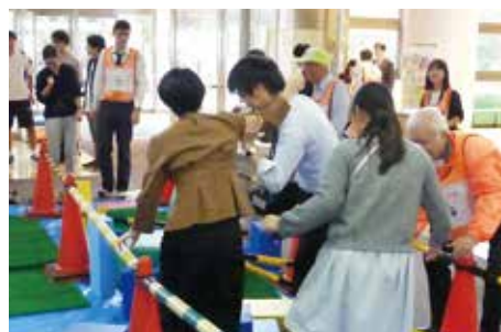
香川大学創造工学部の防災訓練を支援

フォローアップ研修会や市民向け防災講座、学校の防災訓練の支援機会の提供などを通じて、災害・危機対応マネージャーのスキルアップや活動のサポートの役割を果たします。