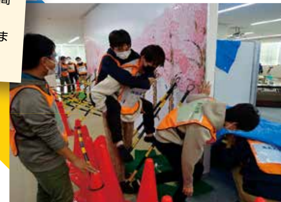
避難シミュレーションゲームの学習