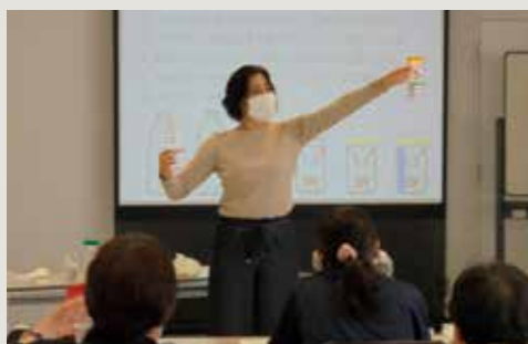
令和3年度まちかど博士前期