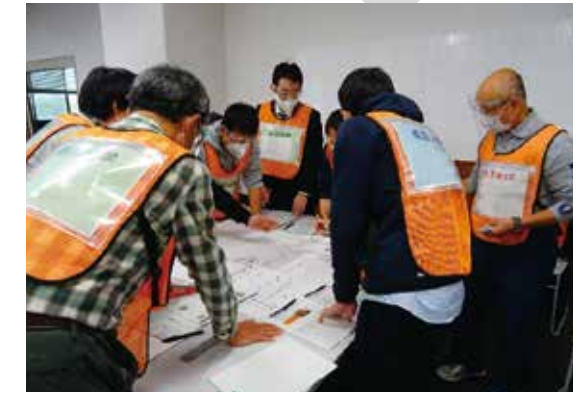
HUG(避難所運営ゲーム)訓練の様子