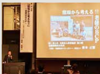
「現場から考える!! 老健のBCP」