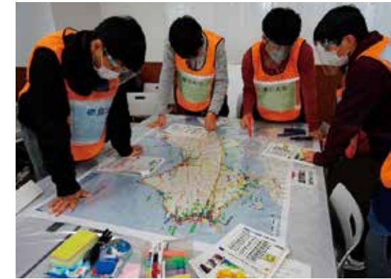
DIG(災害図上訓練)の様子