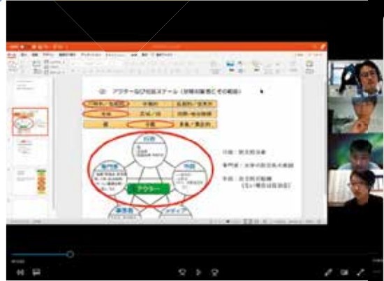
TV会議システムでグループワークの課題発表