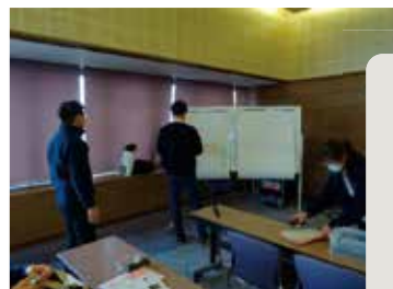
心理的応急処置(PFA)研修の様子