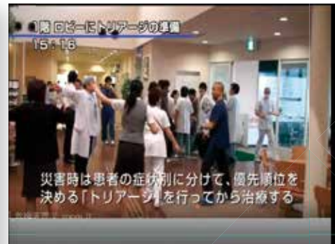
東日本大震災での病院初動の記録