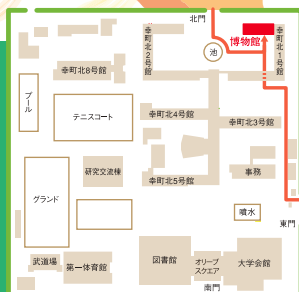
▲香川大学幸町北キャンパス