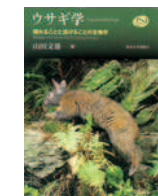
山田文雄 「ウサギ学 隠れることと逃げることの生物学」 東京大学出版会

日時▶ 2017年8月5日(土) 13:00~14:30 場所▶ 香川大学 研究交流棟5階 対象▶ 小学生~一般 定員▶ 100名(参加無料) 事前予約▶ 電話、ファックス、 電子メールにて 当日参加可 ※駐車場なし