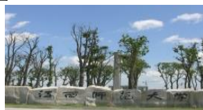
江西師範大学青山湖キャンパス