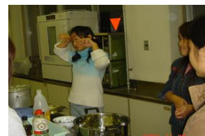
留学生歓迎・交流会 (年4回実施)