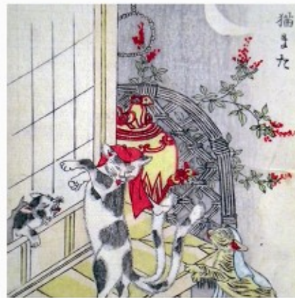
怪物画本（部分図） 明治14刊（1881） 1冊