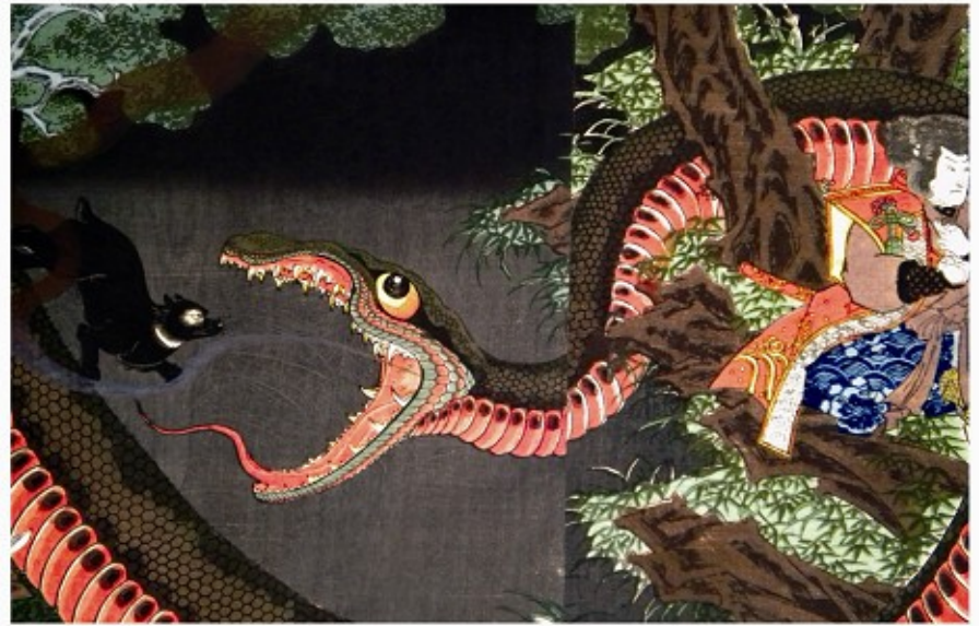
破奇術類光袴垂為揚（部分図） 一英齋芳艶画 3枚

昨年の資料展で好評だった「妖怪展」の第二弾、約1万2千点ある香川大学図書館の神原文庫の中から、天国・地獄の異界を描いた資料、奇怪な様相をした妖怪を描いた著名な資料、日本人に昔から馴染み深い妖怪「かっぱ」を描いた資料、読本としてまとめられた妖怪本などの貴重な資料を組み合わせ、約50点を展示する。