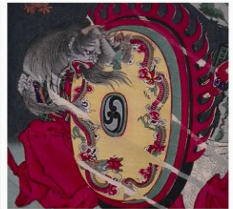
美談武者八景 戸陽の晴嵐（部分図） 一艇齋芳年画 3枚