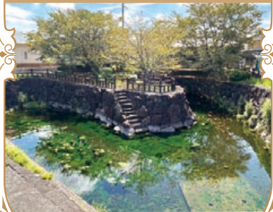
善通寺:二頭出水、市街地各所