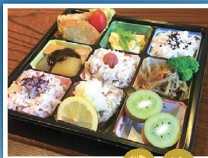
※香川大学キウイっこキャラクター ユニちゃん、プリちゃん