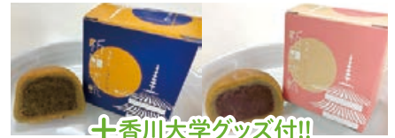
十香川大学グッズ付!!

讃岐ダイシモチまんじゅう【祈願成就】ほうじ茶あんとこしあんのお土産付。地元「山地製菓」さんの人気の菓子。