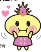
むぎゅ〜ちゃん 讃岐もち麦ダイシモチをPRするために生まれた麦の妖精

善通寺駅では善通寺市長と観光大使「むぎゅ〜ちゃん」のお出迎え・記念撮影があります。