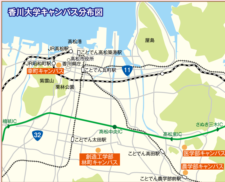
香川大学キャンパス分布図