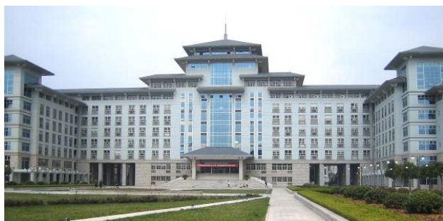
南京農業大学本部