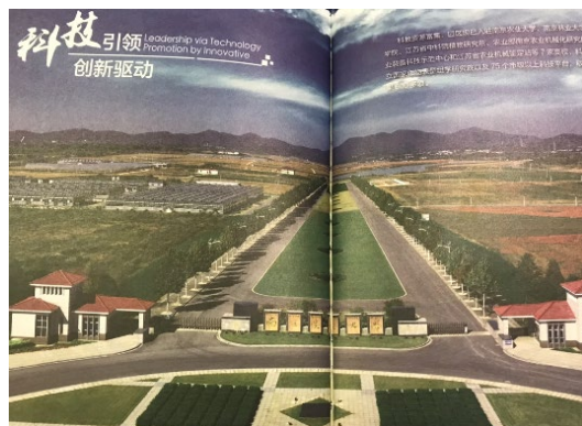
白馬キャンパスは国家農業技術開発の中心地にある