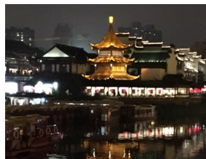
南京夫子廟の夜景