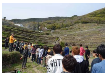
中山千枚田（小豆島）