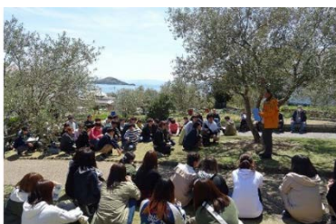
オリーブ公園（小豆島）

TEL 087-832-1657 E-mail: tsuruta.seiko@kagawa-u.ac.jp