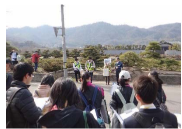
鬼無の盆栽（高松市）