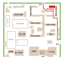
▲香川大学幸町北キャンパス