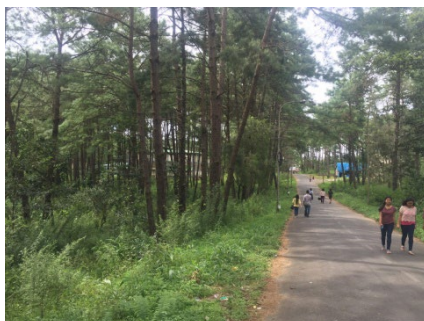
緑の森林が広がるキャンパス