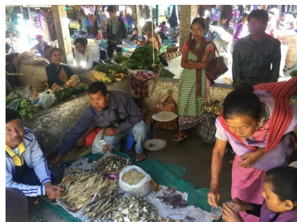
Shillong市のにぎわう市場