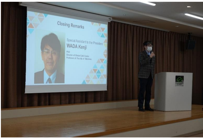
和田グローバルカフェセンター長による 閉会の挨拶