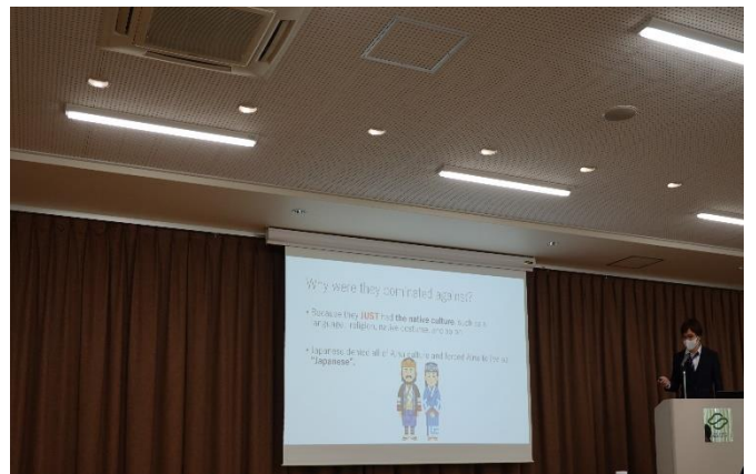
プレゼンテーションの様子