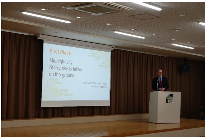
第3回英語俳句コンテスト表彰式