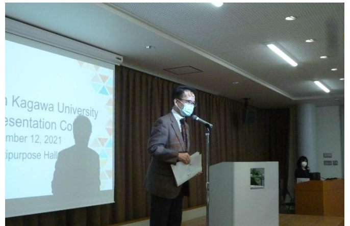
徳田特命教授による講評