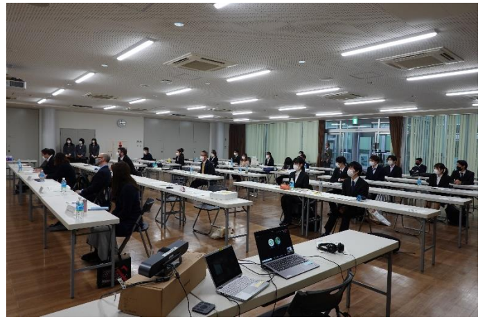
会場の様子 オンライン配信も実施