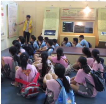
地震教育センター

●学部学生 約6,700人 ●大学院生 約4,900人 ●教職員 約1,000人 ホームページ https://www.ccu.edu.tw/ 交流協定締結年月日：2017年8月18日 主管学部：四国危機管理教育・研究・地域連携推進機構