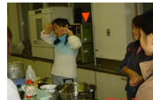
留学生歓迎・交流会 (年4回実施)