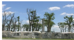
江西師範大学青山湖キャンパス