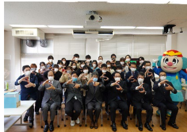
* SETOKU 結成時の写真