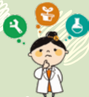
内閣府「理工チャレンジ」イメージキャラクター

建物の設計の方法は、今大きく変わろうとしています。手書きで紙に図面を書くのではなく、パソコンで3次元(3D)の建物のデータをつくり、そこから必要な2次元の図面を取り出すという方法が普及しています。大学の授業で使っている設計のソフトを使って、ぜひ今のものづくりを体験してください。前半は、パソコンを使って建物の設計にチャレンジしてください。パソコンに慣れていない人でも、大丈夫。ラボの学生がサポートします。後半は、釜床先生と大学院生・学部生の研究やキャリアのお話と意見交換を予定しています。