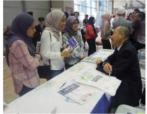
本学ブースの様子