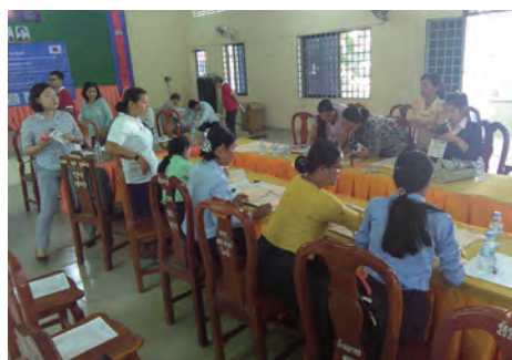
2018年11月に実施したセミナーの様子

本学が香川県と共同実施している標記プロジェクトは2年目に入っており、目標の達成に向け順調に推移しています。今期は2018年11月と2019年2月および3月の3回、本学教員が現地に出張して現地の小学校の先生方に対する保健教育の