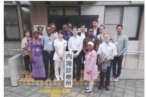
小豆島 内海診療所にて

日本政府は、発展途上国の将来の国づくりを支える青年リーダー層に対する技術研修事業を行っています。その一環として、本学は2018年9月30日から10月13日の14日間、アフリカの8か国(ブルキナファソ、ブルンジ、カーポベルデ、中央アフリカ、チャド、コートジボワール、モロッコ、トーゴ)から10名の研修員を受け入れ、本学医学部を中心に香川県内の地域保健医療体制について講義を受けたほか、小豆島に渡ってICTを使った遠隔医療についても学びました。忙しいスケジュールの合間には屋島や香川県立ミュージアム、広島、宮島を訪問して日本の歴史・文化等についても理解を深めるとともに、フランス語を履修している本学学生との交流も行いました。