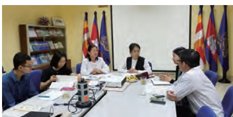
2019年2月教育省関係者との協議の様子

本学が香川県と共同実施している標記プロジェクトは2年目に入っており、目標の達成に向け順調に推移しています。今期は2018年11月と2019年2月および3月の3回、本学教員が現地に出張して現地の小学校の先生方に対する保健教育の